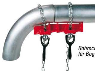
Rohrschweißschraubstock für Bogen