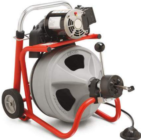
Modell K-400 mit AUTOFEED®

Alle K-400 Maschinen werden mit RIDGID® Rohrreinigungshandschuhen und Anwendervideo (EN) geliefert.