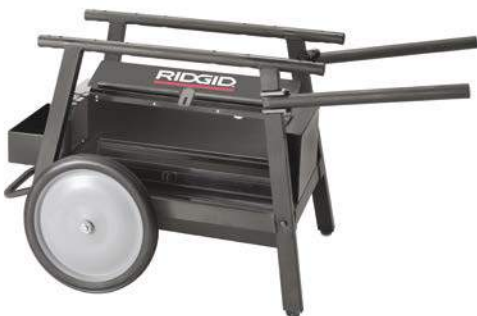
Modell 200A mit Werkzeugkasten