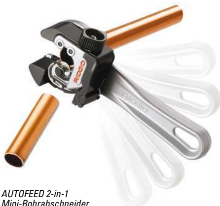
AUTOFEED 2-in-1 Mini-Rohrabschneider

* Modelle 101 und 118 mit Ersatzschneidrad im Knauf.